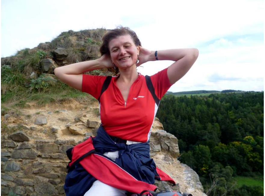
Ale je to tu pěkné, že?