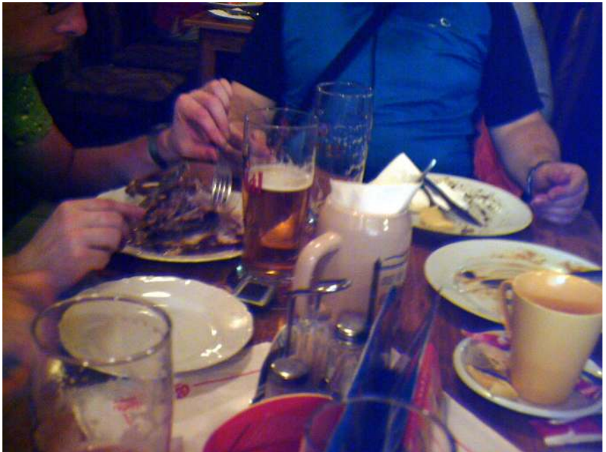
Oběd po bouře