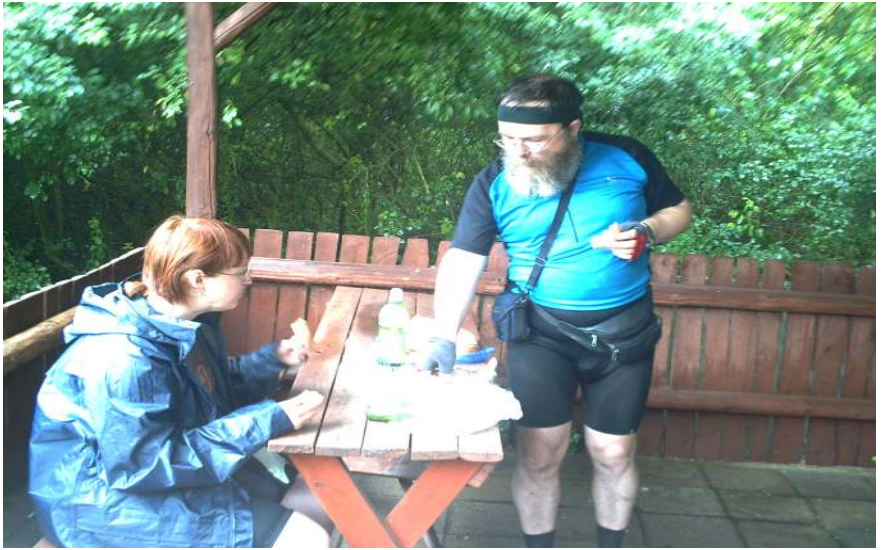
Svačinka po bouře...