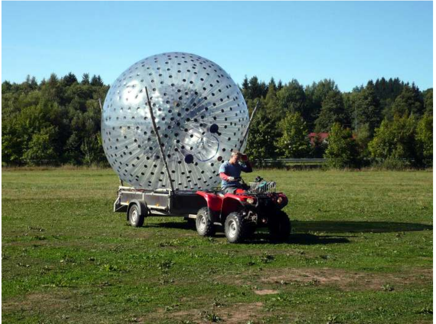
převážení kuliček z údolí na kopec