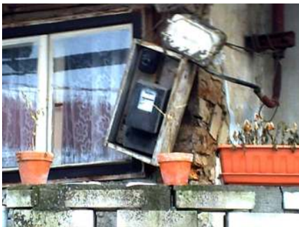
Možná i F.L. Věky.