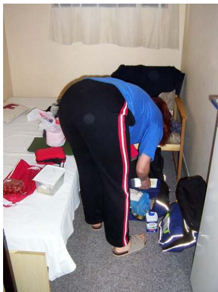
Úchvatné interiéry penzionu U dvou studní...