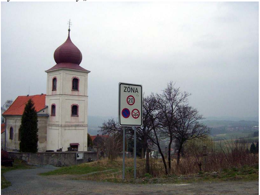
... do kostela vjíždějte rychlostí max 20km/h, ne na koni a hlavně nezastavovat...