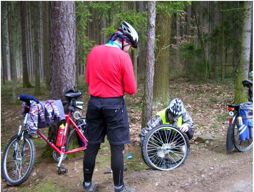
Výměna Michalovy „černé duše“...