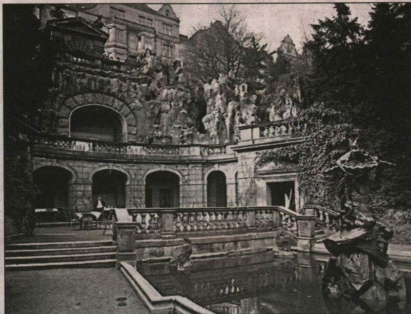
Grotta (Neptunova jeskyně) v Havlíčkových sadech. V popředí zahradní restaurace u jezírka se sochou Neptuna.

Tak přibližně takhle to mám v paměti. Jenom trochu zdevastovanější a zavřené.