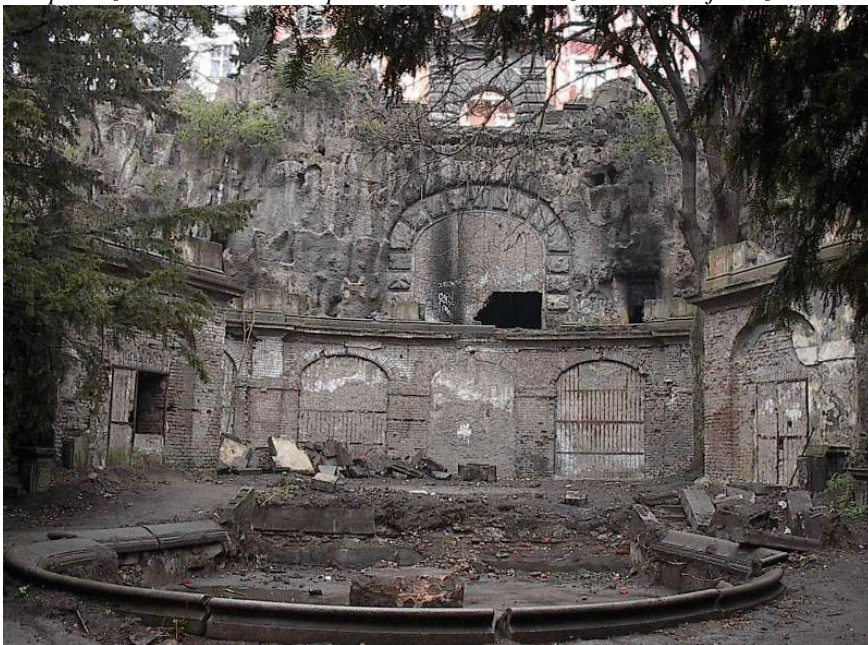
A takhle je to dneska!

Tak přibližně takhle to mám v paměti. Jenom trochu zdevastovanější a zavřené.