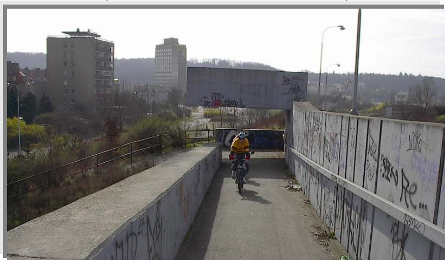
No tak nevim. Ale nejspíš to byla 1. stránka.

V sobotu se scházíme v Jeskyni okolo deváté hodiny ráno. Kluci ještě dodělávají nějaké úpravy na kolech. Kolem desáté konečně vyjíždíme. A zase jedeme nejprve na Vinohrady, protože Dig zapomněl doma peněženku. Pak jedeme na Nuselský most, dolů do Podolí a přes Barrandovský most