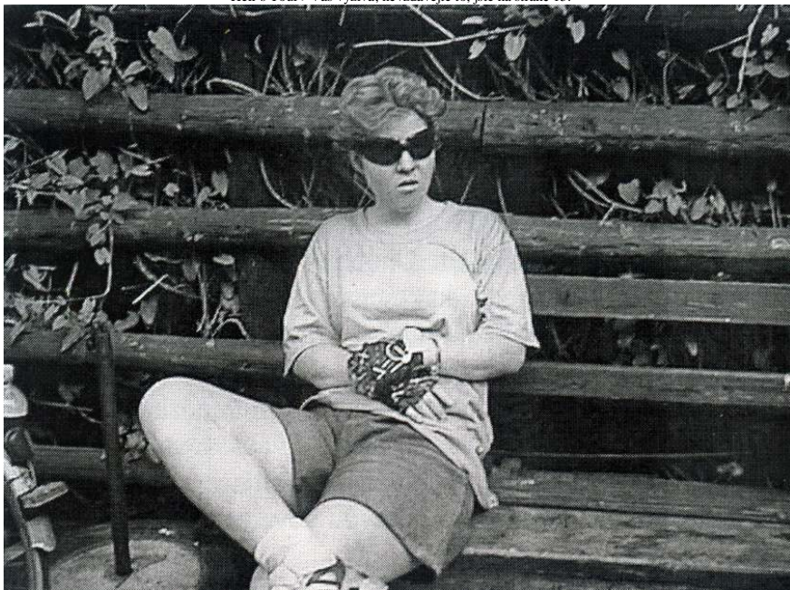
A takhle jsme se přepapinkali