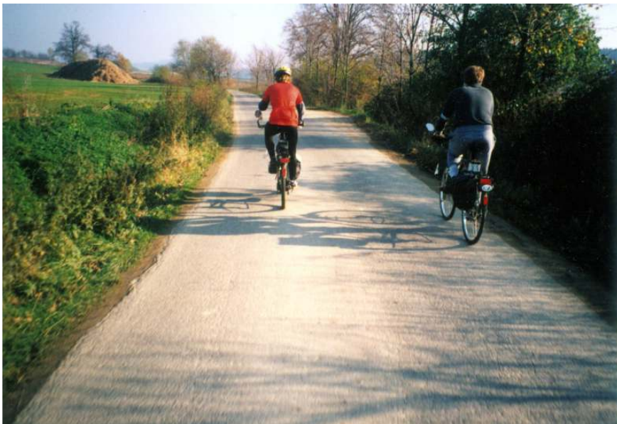
Úleva po předešlém terénu...