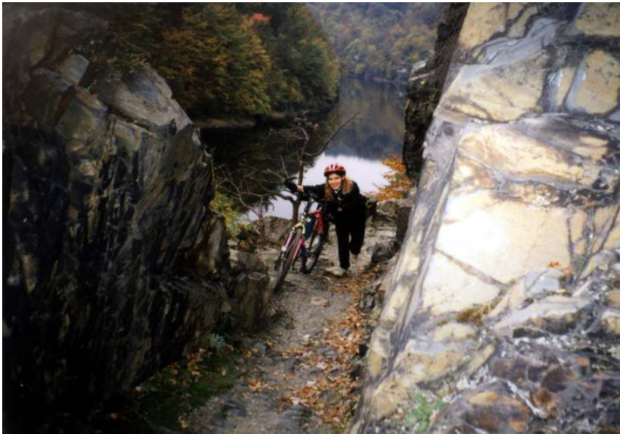
pohodlný průjezd Štěchovickou stezkou.