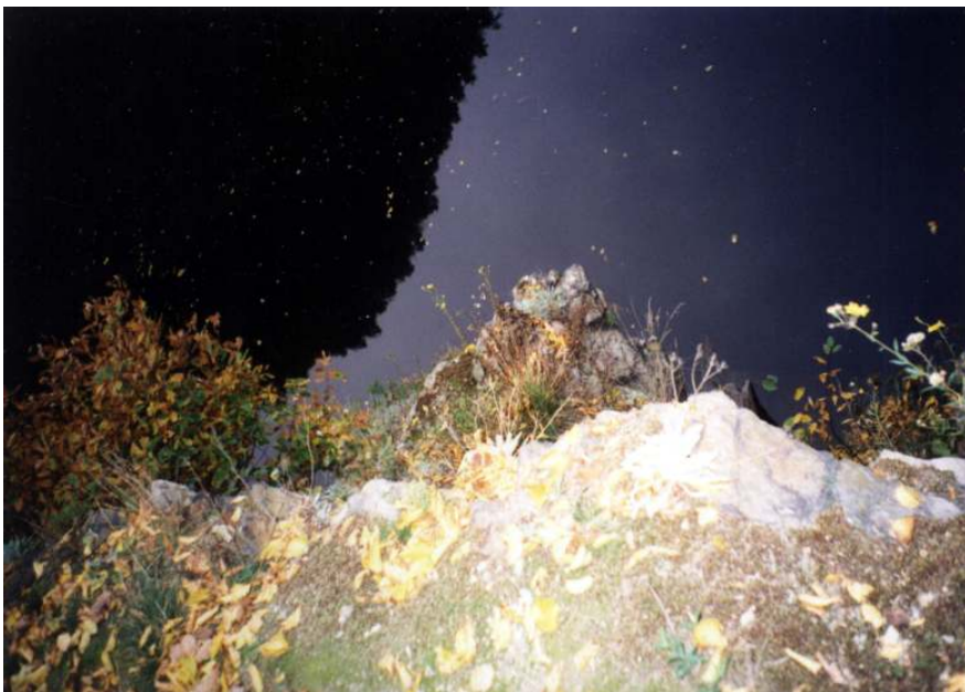
Koukáme Svatojánské proudy. Kdysi.