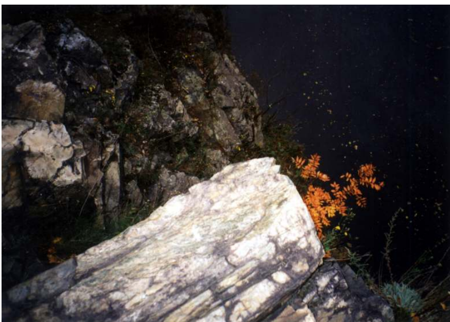
To je stále pohled na ony proudy.