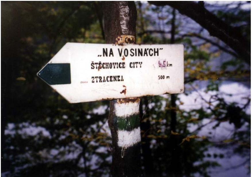
Vidíte? Já to říkal! Štěchovická...