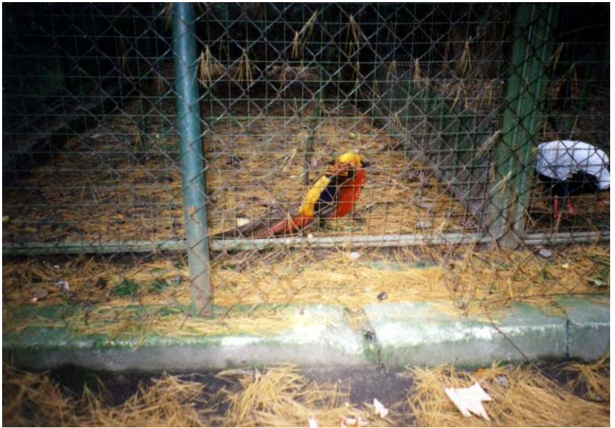
Zlatý bažant – zvíře, nikoliv slovenské pivo.