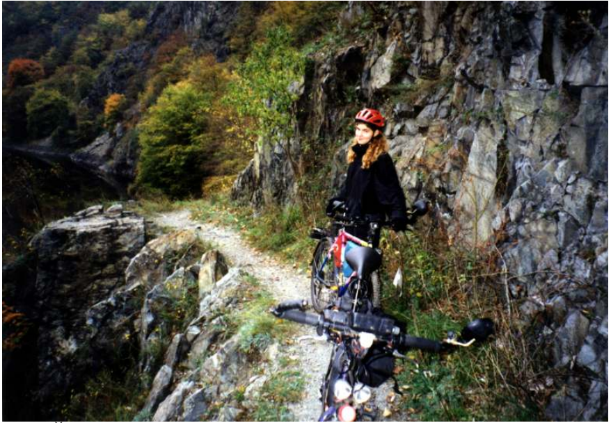
Stále Štěchovická stezka.