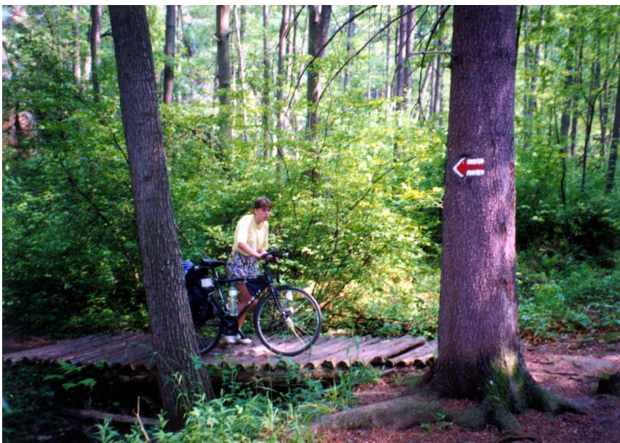
pořád Údolí Pekla