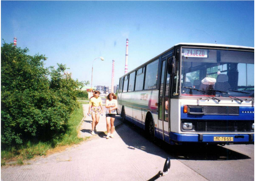
Blanka, Lenka, autobus a vedro