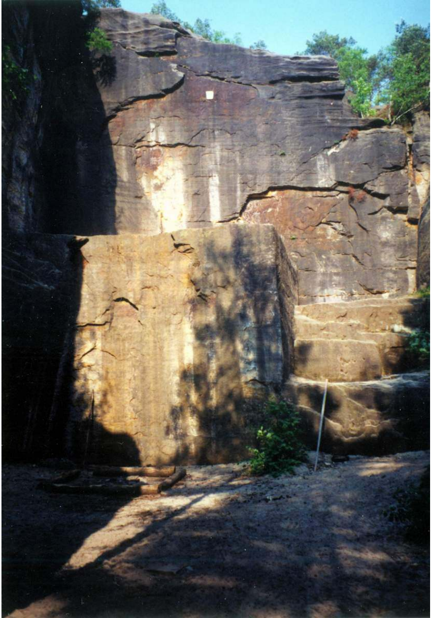
Stolová hora... u České Lípy