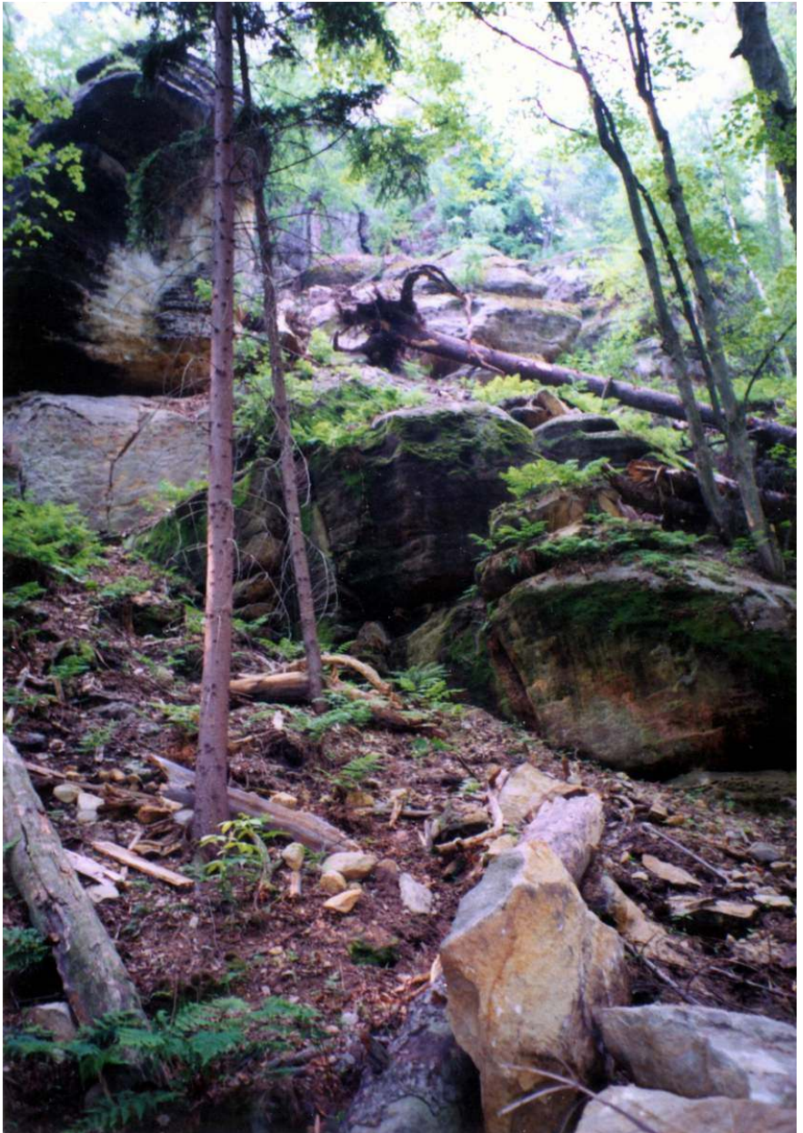
z Pekla cesta nevede