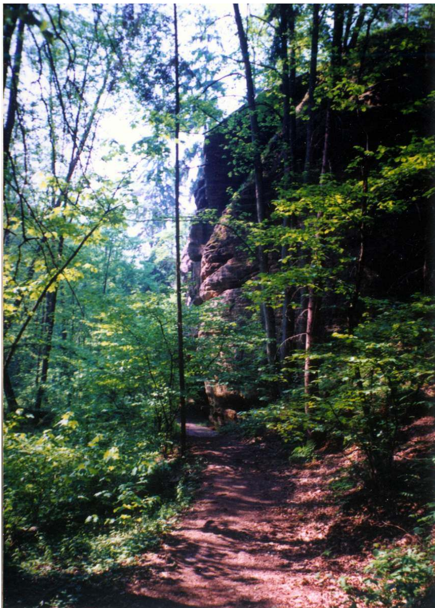
cesta do Pekla