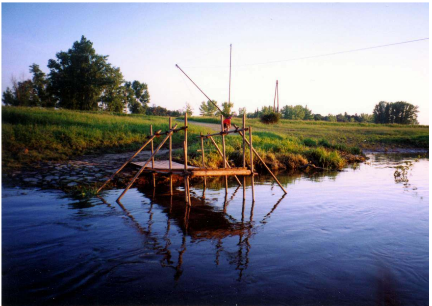
Blanka se loučí s břehem