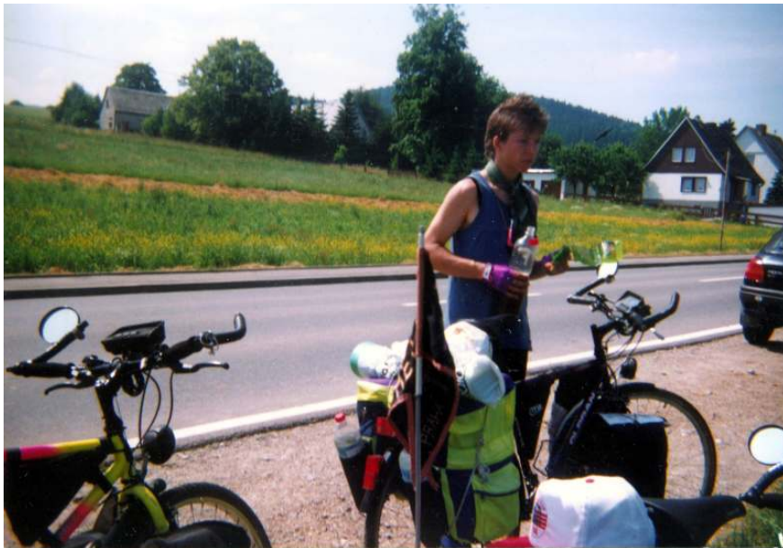
Malá pauza v AUE na vrcholu kopce.

Přijíždíme na předměstí AUE. Nastávají první potíže. Je vedro, mají to tu do kopce a po kostkách. Strašné! Jedeme dál. Vedro narůstá, povrch se mění... k horšímu, přesto ale neměníme rychlost postupu.