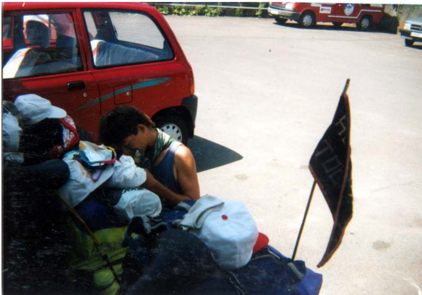
Německo, před supermarketem Edeka