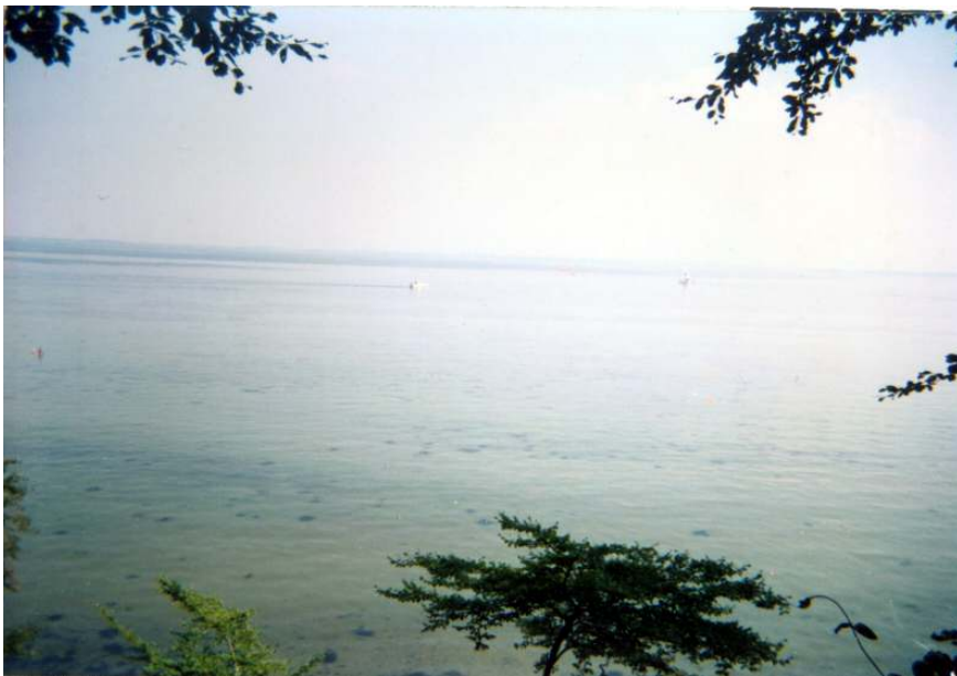
Toto je pohled z výšky 15 metrů na moře...

Teploměr na palubě teď ukazuje 33°C. A to jsme v „milosrdném“ stínu. Po nějaké době jsme konečně začali klesat. Přesněji sestupovat. Klesat už nemáme kam... I když... zbývá mravní bahno... ale to probereme jindy. Sestup je také dost hrozný. Všimli jste si také té zvláštnosti, že jakmile se ocitnete v blízkosti moře, je najednou všude písek? Tak my ano. Zejména proto, že vláčet naložená kola pískem je poněkud obtížné. Takže přestože jdeme dolů, dřeme jak Bulhaři.