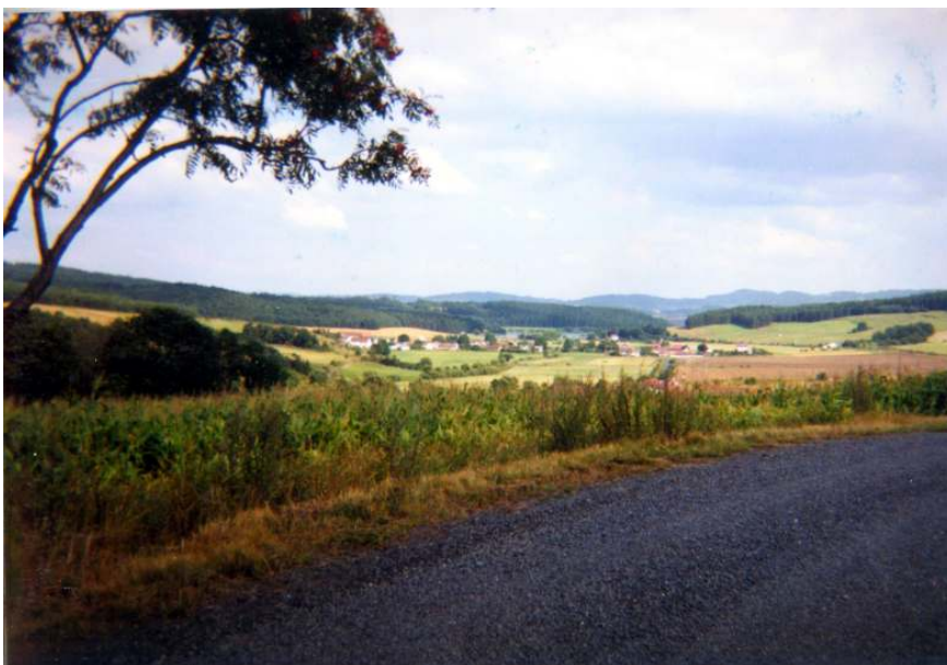
Dánsko, úplně přesně vím kde, ale ne a ne si vzpomenout...