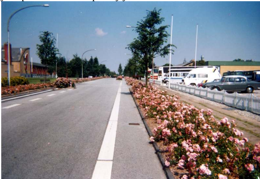
Tohle je jedna z hlavních ulic.

Zastavili jsme ve městě CHRISTIANSFELD. U nějaké garáže jsme z volně přístupného kohoutku „nakradli“ 11 litrů vody do všech našich nádrží a přesunuli se k nedaleké otevřené samošce. Koupili jsme požel a v blízkém parku jej snědli. Jedeme dál.