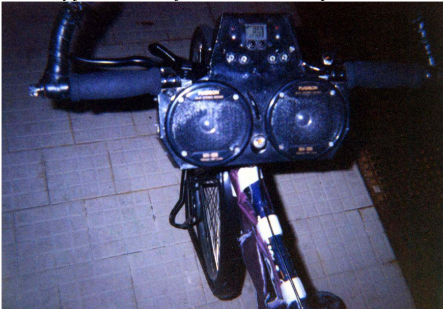
Nová paluba vzor 95.