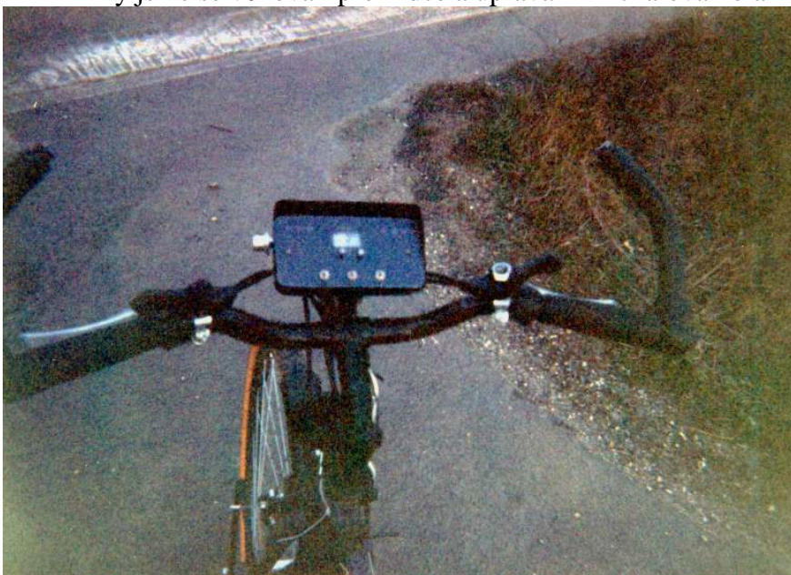
Pohled na před Michalova kola.

My jsme se věnovali prohlídce a úpravám Michalova kola