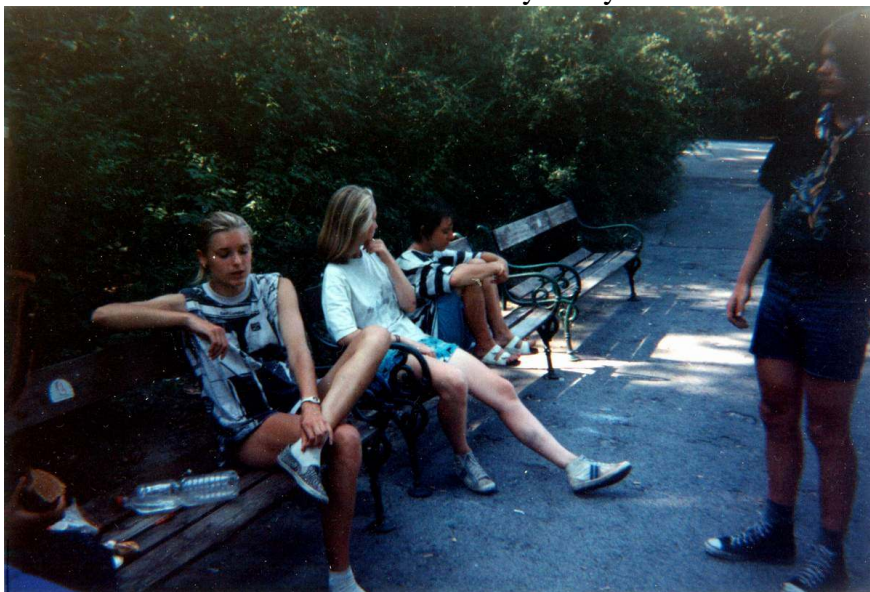
Po návratu z ambasády.

Před šestnáctou hodinou se vrátily holky.