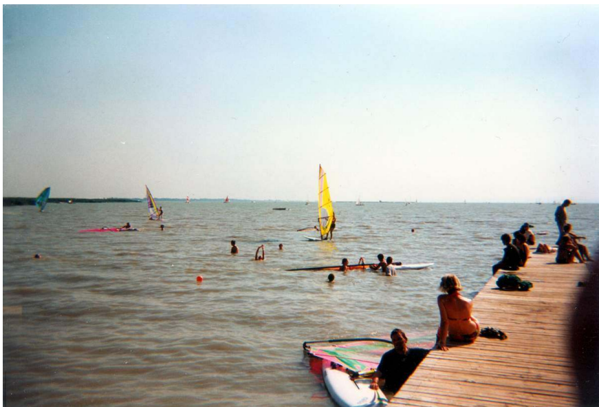
Pohled z hlavní pláže na jezero.

Kolem sedmé jsme se zase sešli u stanoviště Slizky-L. Já jsem ji několikrát za odpoledne navštívil, půjčil jí můj velký (metr krát metr) šátek namočený ve vodě. A protože spala, opatrně a tiše jí ho po opětovém namočení pokládal na záda. Ostatní po ní ani nevzdechli.