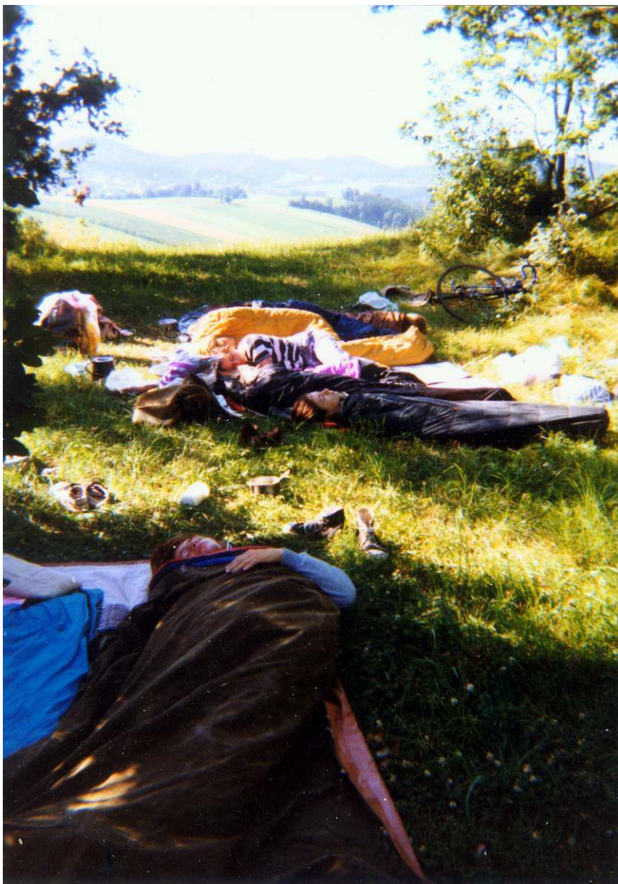
Takhle to vypadalo skoro každé ráno...