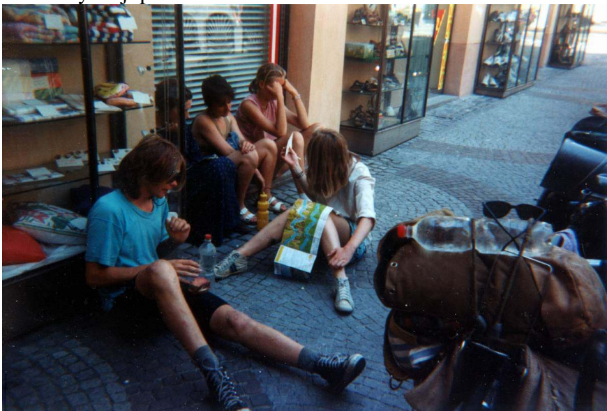
Krems – odpočinek a počítání kilometrů.