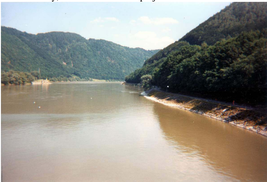
Pohled z ochozu elektrárny do údolí.

Dojeli jsme k vodní elektrárně a po odpočinku jsme se většinou hlasů rozhodli pokračovat po druhém břehu. Neměli jsme tušení, že budeme muset zdolat 30 schodů nahoru a 30 schodů dolů uvnitř budovy, skrz kterou se musí projít.