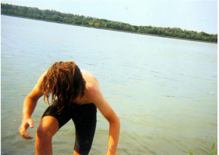
Miky opouští Dunaj.