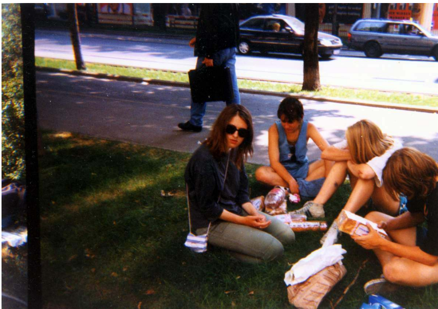
Vídeň – po zjištění škod.