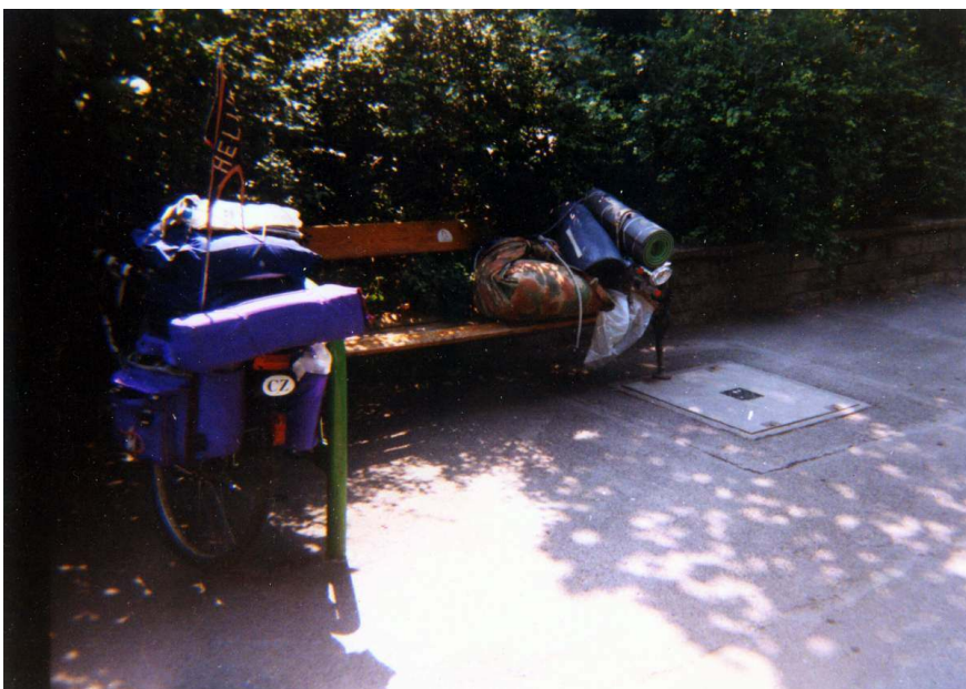
Vídeň – neslavné zbytky rozkradené výstroje.