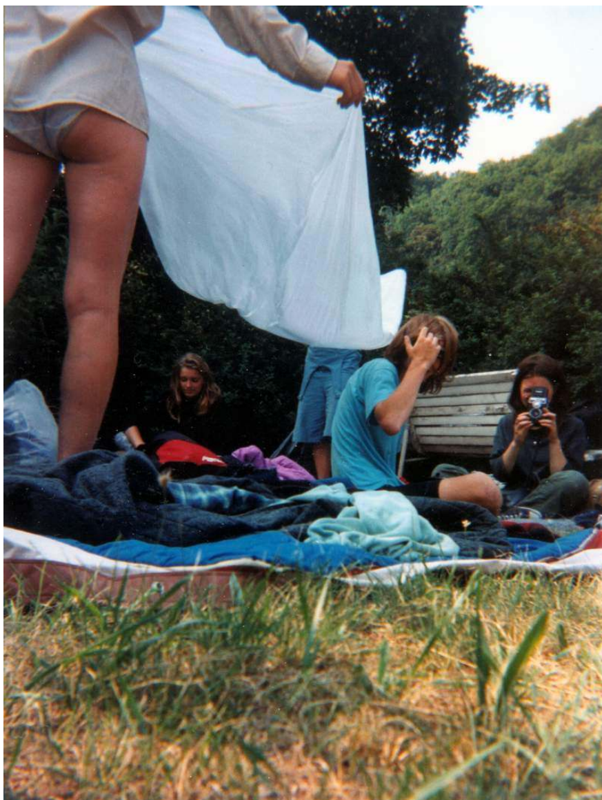
Pořád v parku...

Balíme, odjíždíme. Dnes je jediný bod programu – prohlídka města. Ve 12 hodin opouštíme místo noclehu a jedeme do centra. Po hodině jízdní prohlídky zastavujeme u Stadtparku.