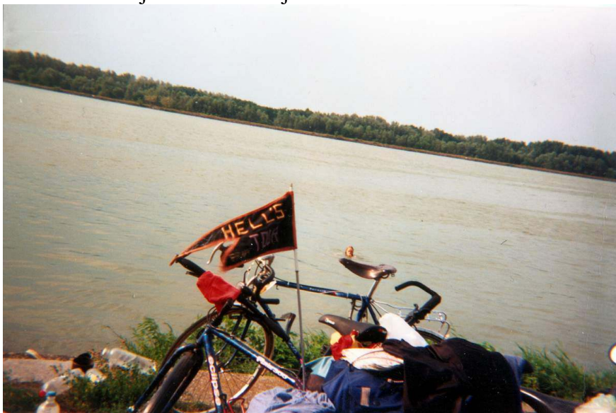
Zaparkováno, vaření zahájeno.

Dostali jsme hlad a tak jsme se dali do vaření.