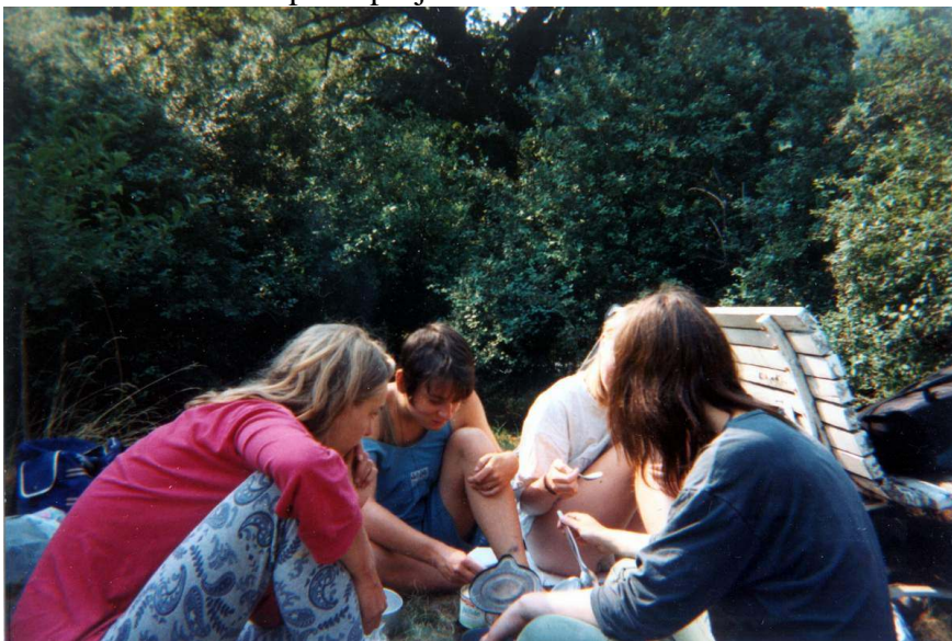
Snídaně v trávě na klidném místě na předměstí Vídně.

Vstáváme, snídáme, to vše za zvědavých pohledů všech, kdo se sem momentálně přišli projít.