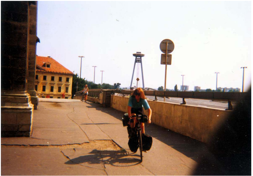
Triumfální vjezd do Bratislavy