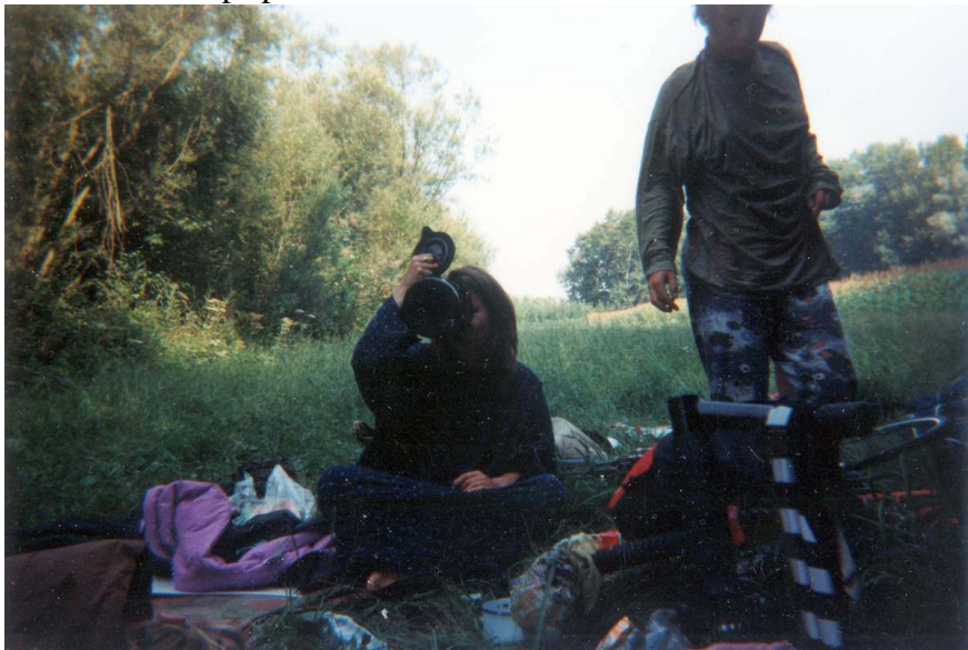
Slizka+P s konvicí v ruce...

návratu je obrázek jiný. Všichni něco podnikají. Vypadá to jako velmi zmatená příprava snídaně.