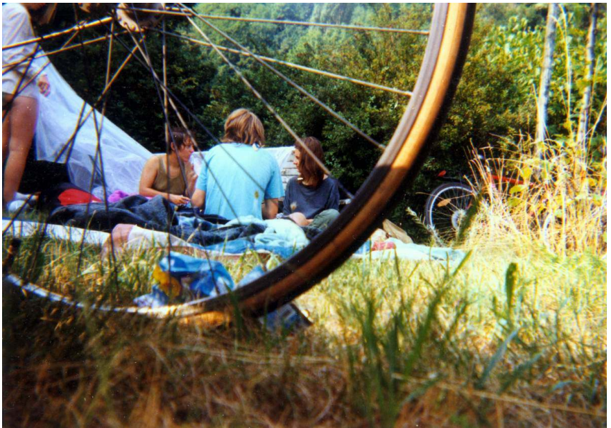
Vídeň - ráno v parku na předměstí