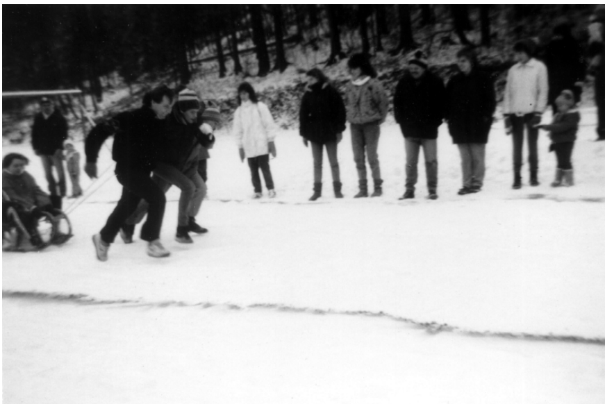
A je odstartováno. Družstvo Prahy 4 nabralo tempo a řítí se vpřed...