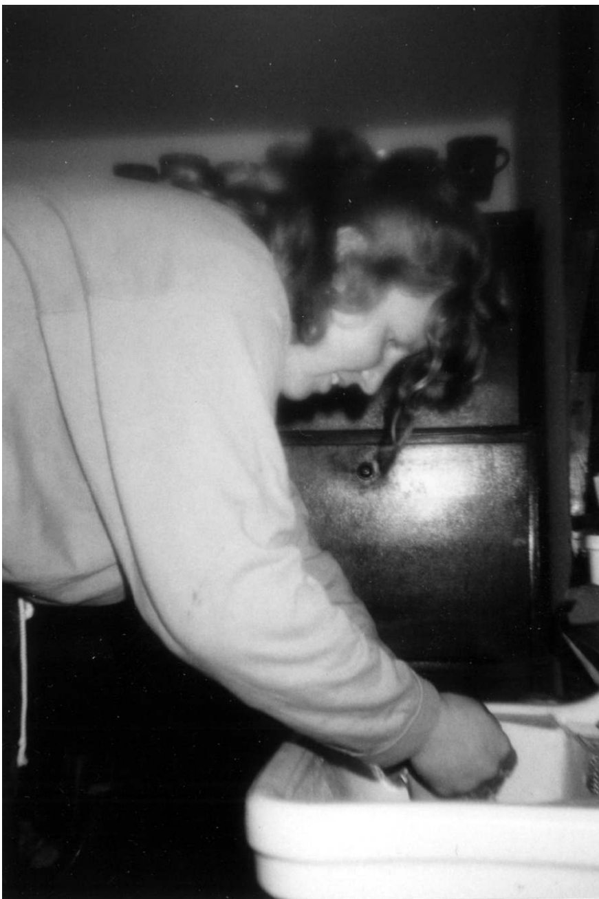
Útok na hygienu.