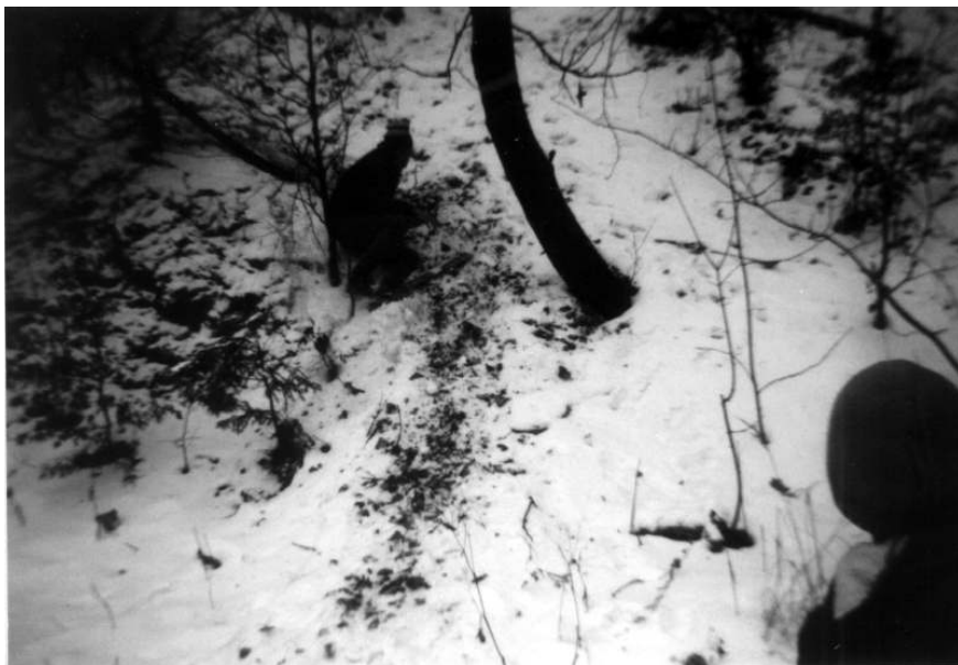
Zde máme pohled na náročný lesní úsek...