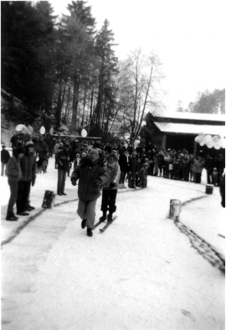
vedou si velmi dobře...