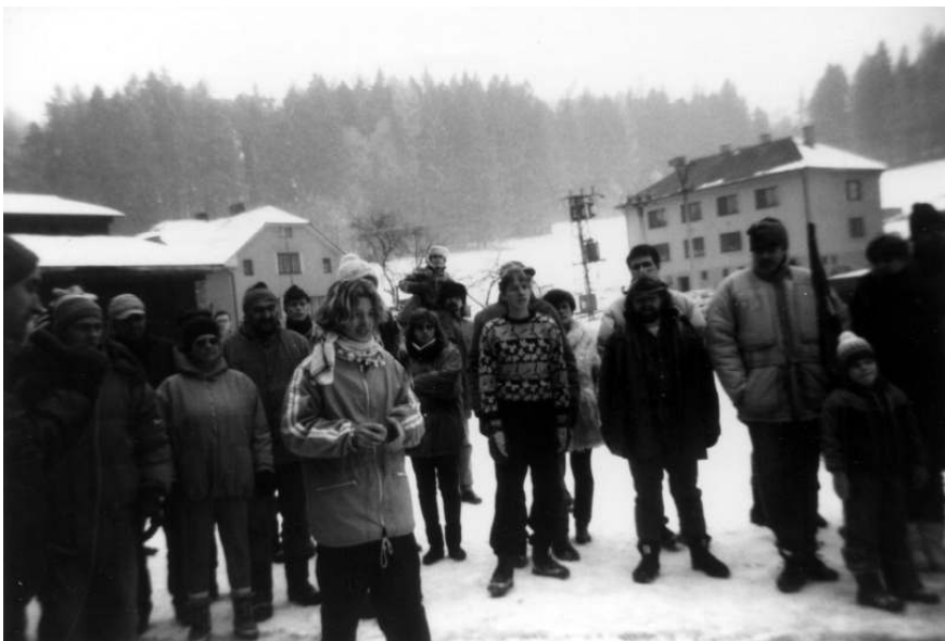
Je zde spousta významných představitelů okolních obcí i zástupci Prahy...