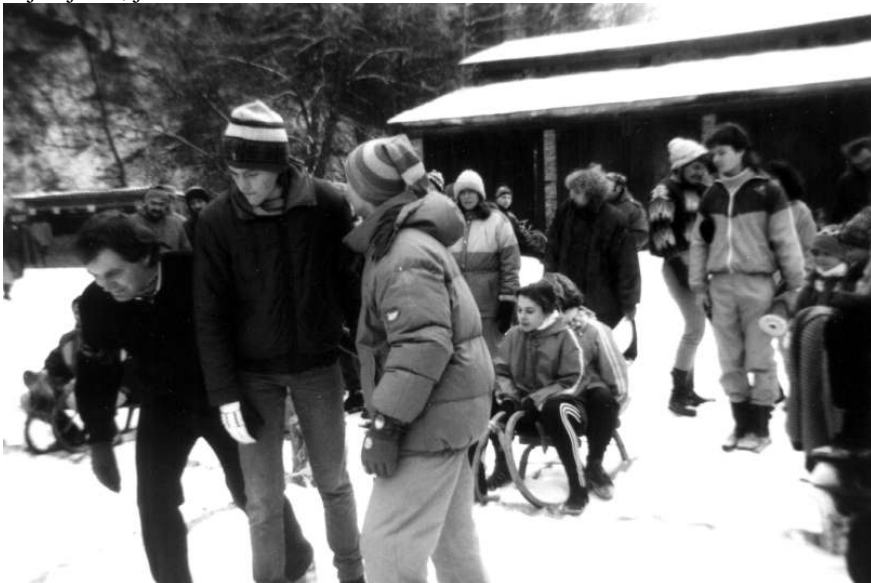
Poslední udílení rad trenérem před startem.

Další závod je Psí spřežení. Jednoduché: sáně, 2 tahouni, 2 náklad. Štafeta, všichni vystřídat na všech pozicích tak, aby proběhly všechny kombinace dvojic. A jak jinak, je to na čas.