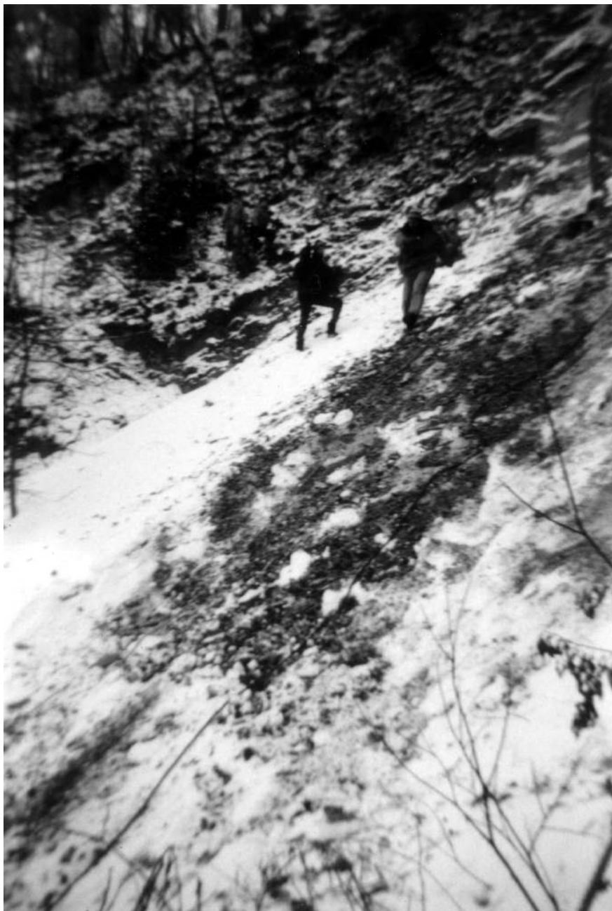
Cestu vzhůru se snaží pokořit Miky (dráha vzdálenější od kamery).