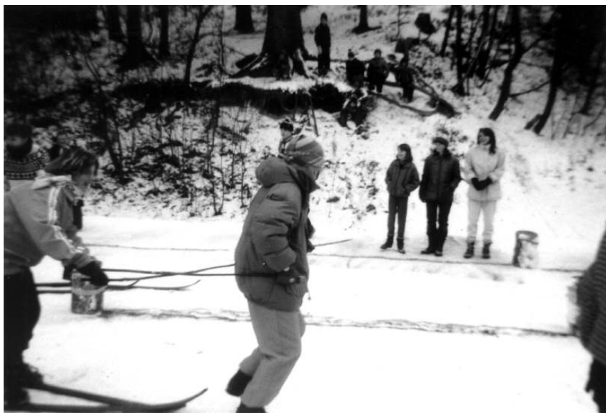
na trati, za mohutného povzbuzování...