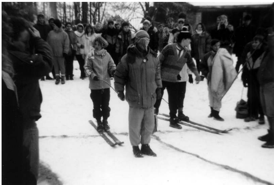
těsně po startu