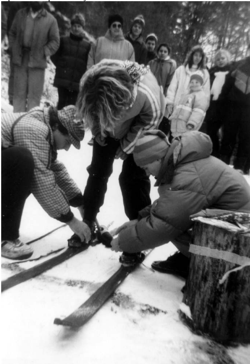
Jana = Jezdec, Tomáš = kůň.

Slepí koně. Jezdec je připevněn na lyže, slepý kůň má zavázané oči, táhne jezdce pomocí hůlek a je jezdcem slovně naváděn na cíl. Opět je to štafetově a na čas a započítává se i přezouvání jezdců.