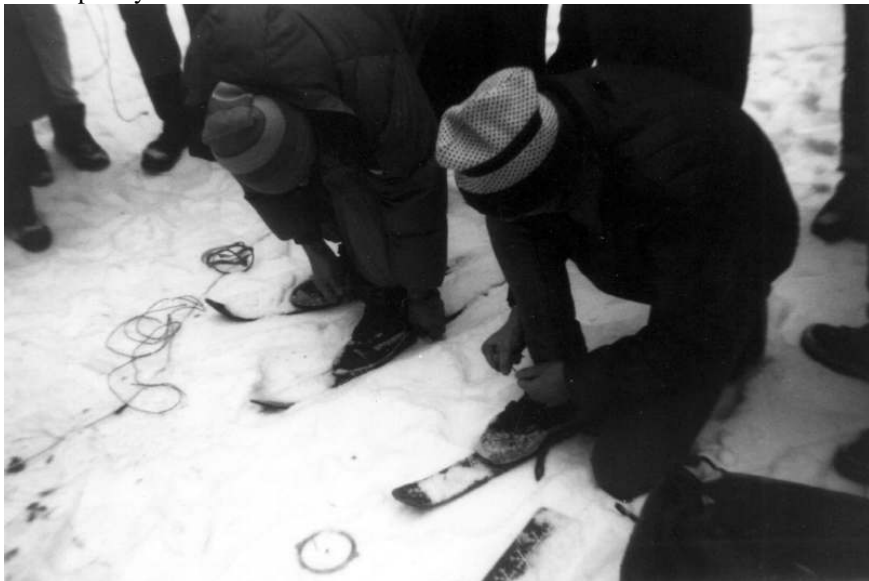
Za Prahu 4 nastupuje sám velký Tomáš...