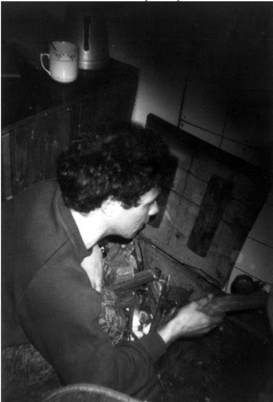
To je onen PYROMAN