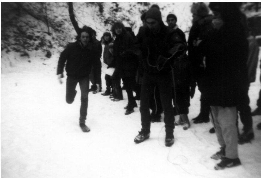
Miky v cílové rovince...