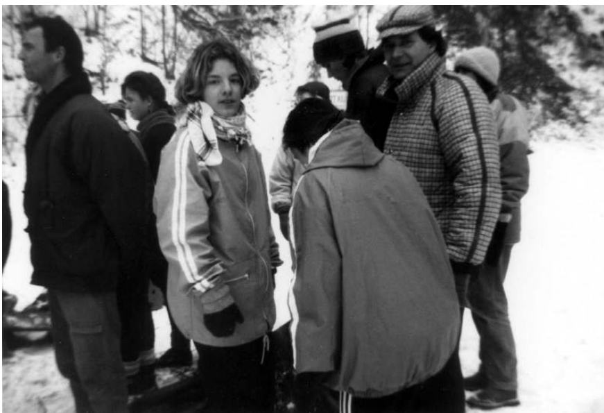
Chvilka oddechu a příprava na další závod.