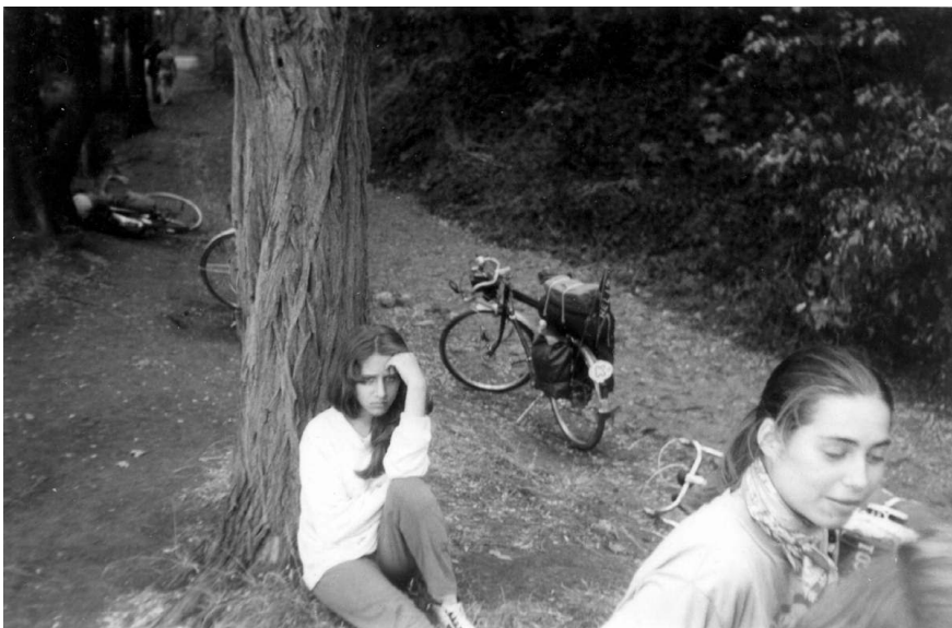
a téměř opuštění světa vezdejší