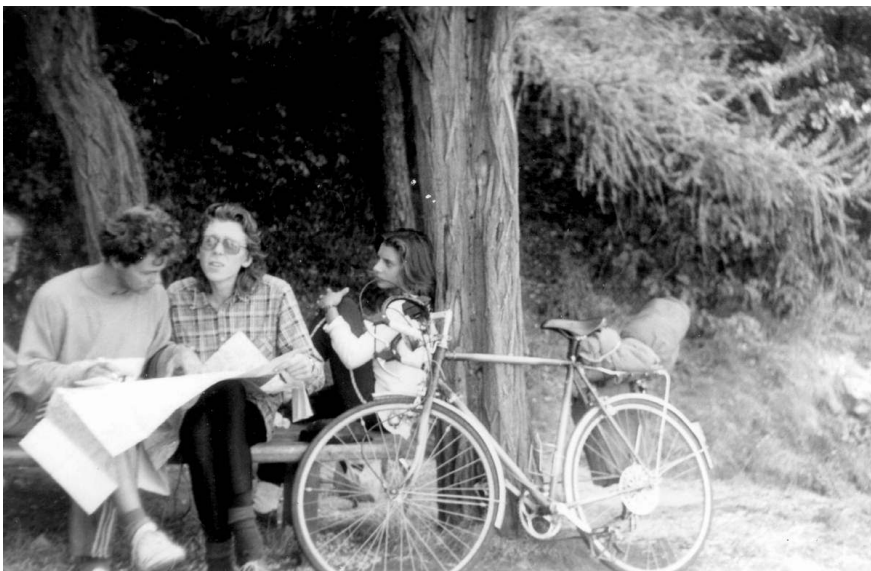
S jedním odpočinkem