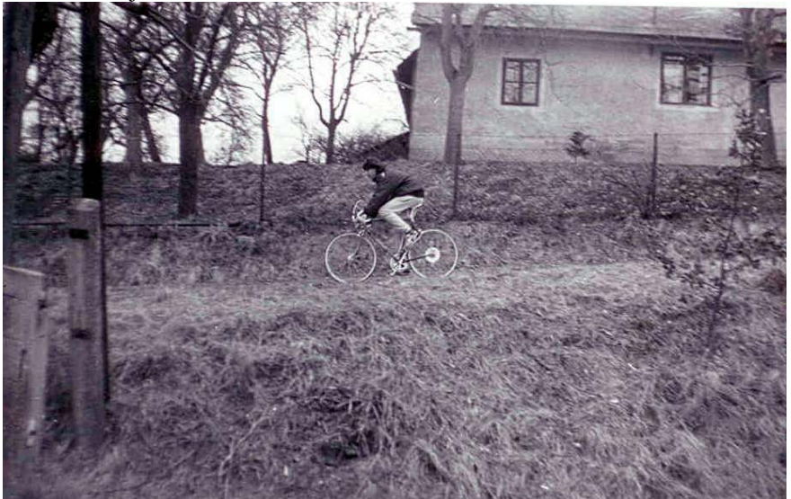
Toto je Dalibor