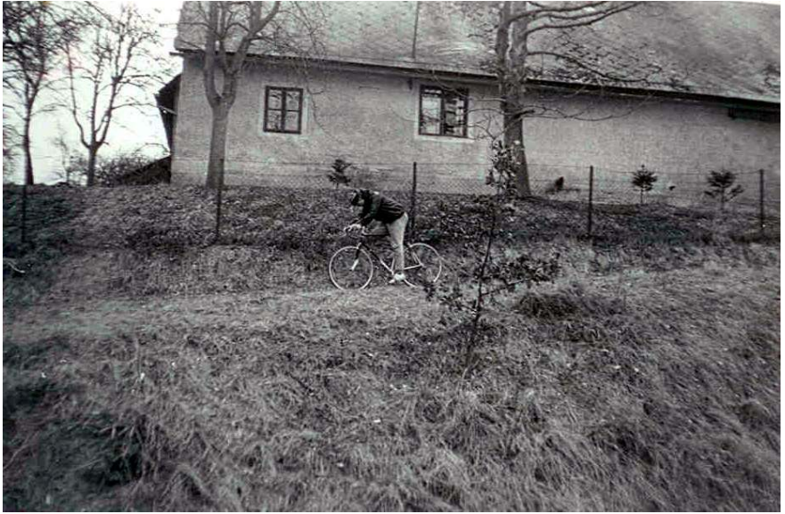
Tady vidíme Zdenka.

Trasa je vymyšlená takto: Lužany, Konecchlumí, Lázně Bělohrad, Lužany. Okruh asi 30 km. Jde skutečně jen o projížďku, Nevezeme s sebou nic než peníze, svačinu a PCD 1. jediný záměr je navštívit hospodu v Konecchlumí. Mají tam totiž výbornou zmrzlinu. Toto se také potvrdilo. Odtud pak jedeme okreskami. Jede se dobře. Nikam nespěcháme, bavíme se mezi sebou o všem možném