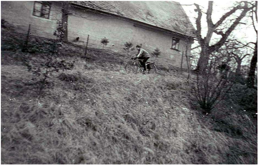
Zde jede Tomáš