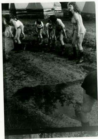
... neidentifikované pohyby- detail 1