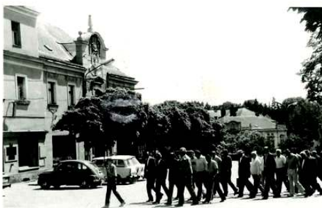
pohřeb ve Světlé n /Sázavou I.

Pokračujeme v cestě. Dále máme namířeno do Záběhlic. Ale vlivem nepřesností v mapě jsme se ocitli v Řečici. Poprvé jsme se řídili mapou a ne instinktem a orientačním smyslem a netrefili se do místa, kam jsme chtěli dorazit. Bez dalších problémů jsme pokračovali přes Bystrou, Křepiny, Dolní Město, Lipničku do Světlé n /Sázavou. Tam jsme zarazili na náměstí, ochladili se pitím a dali si zmrzlinu. Při konzumaci toho všeho jsme viděli klasický vesnický pohřební průvod. Také jedna z věcí, které chtěly vidět naše bývalé spolujezdkyně.