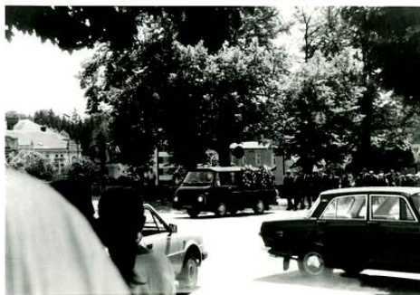
pohřeb ve Světlé n /Sázavou II.

Chvilí jsme ještě seděli a studovali mapu. Rozhodli jsme se pro