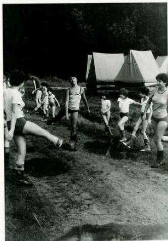
... neidentifikovatelné pohyby- detail 2

Když jsme všechno patřičně zkritizovali, začali jsme s balením