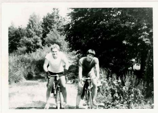
... triumfální odjezd z LPT VM Janovka