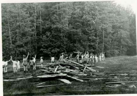
... neidentifikovatelné pohyby- celkový pohled

akce jsme si prohlédli tábor / viz str 11 /.